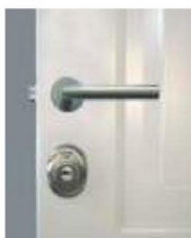
Manilla sobre cerradura