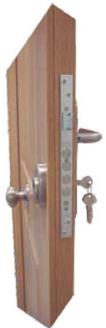
Detalle cerradura central de 3 puntos