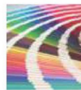
Lacado Carta RAL