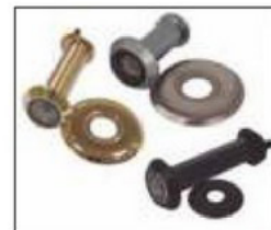
Mirilla con embellecedor