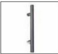
Tirador tubular 342 y 700 mm.