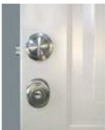
Pomo fijo sobre cerradura